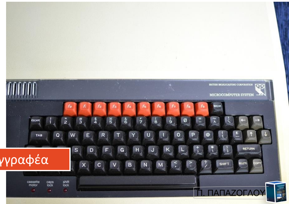
Φωτογραφία του συγγραφέα